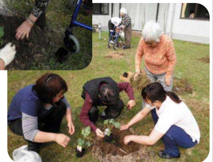
天気の日を見計らってすいか、かぼちゃ、ゴーヤの苗を中庭に植えました。入所者の皆さんのほうがよくご存じなので「これはこうしてな・・・」とアドバイスしていただきました。収穫がとっても楽しみです。