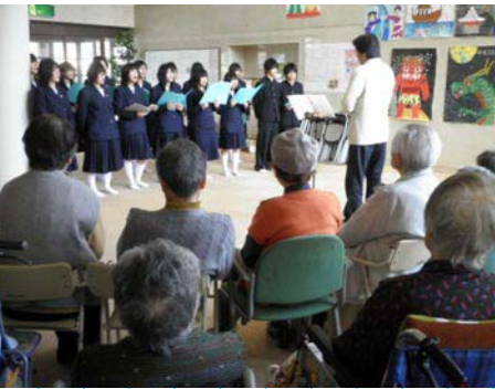
若い皆さんのブラスバンドや合唱で楽しいひと時を過ごすことが出来ました。