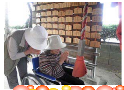
当日はお天気にも恵まれ、延命地藏参りに行かれ楽しめました。