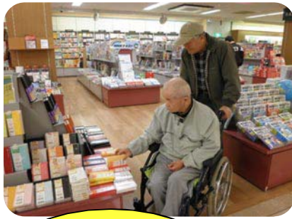
ボランティアの方と一緒に楽しくお買物されていました。