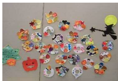
「あきのリースをつくろう」