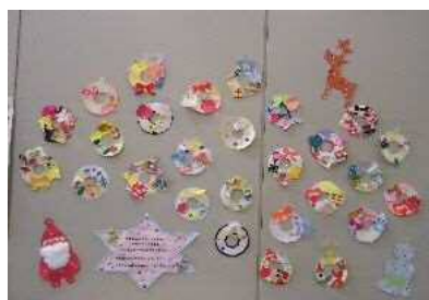
「ふゆのリースをつくろう」