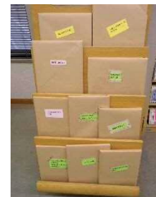
「絵本を読んでもみませんか」