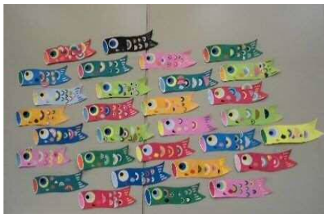
「こいのぼり」をかざろう