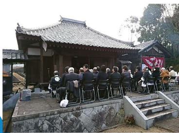
加東市赤穂義士祭