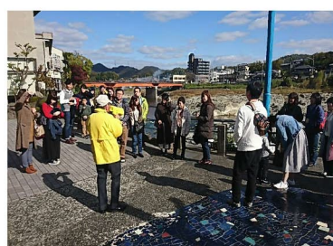
ウォーキングツアーのサポート