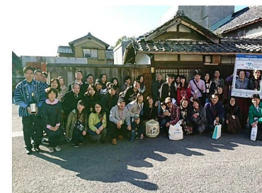
バスツアーのサポート