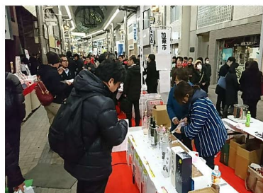
北播磨の酒元町バル