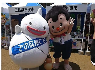
キャラクターフェスティバルinすみだ