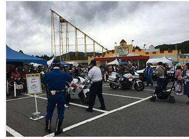
はたらくくるま大集合