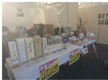
マイナビABC物販出展