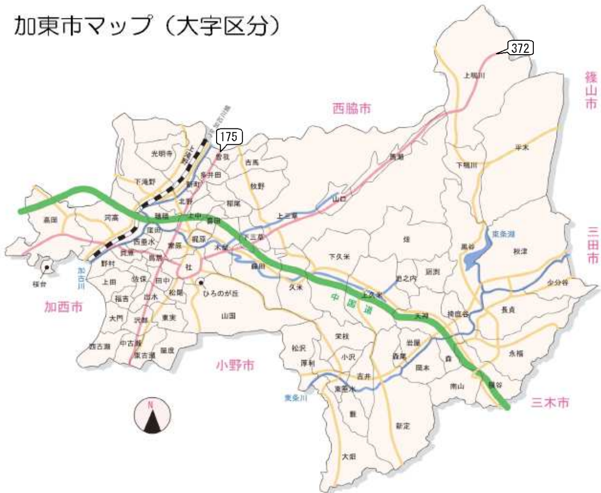
加東市マップ（大字区分）