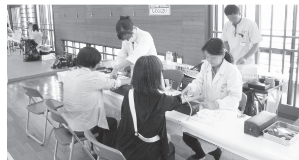
健康福祉部健康課(庁舎2階) ☎42-2800

日 11月11日(土) 8時30分~11時20分 ※申込時に受診希望時間を選べます。