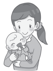
健康福祉部健康課(庁舎2階) ☎43-0432