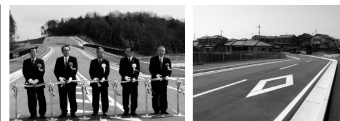
国道372号社BP山国工区開通式 市道山国社線

3月25日、国道372号社バイパス山国工区の開通式が行われました。また、国道の開通に伴い、市道山国社線も供用を開始しました。 社地域の市街地を縦横断する幹線道路の開通により、市街地周辺の交通混雑緩和や交通事故防止などに大きな効果が期待されます。