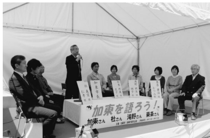
ステージイベント「加東を語ろう！」

4月19日、清水寺において第25回鴨川桜まつりが開催されました。 当日は、太鼓演奏や演芸・歌謡ショー、お茶席、仏像彫刻展などのほか、桃ジャムやハチミツなどの地元特産品の即売会も実施され、多くの人出で賑わいました。 また、今回は「加東」「社」「滝野」「東条」の姓を持つ方々を各地からお招きし、加東市について市長と対談していただく「加東を語ろう！」も行われました。対談に参加いただいた方からは、「加東市が持つ交通特性を生かしたまちづくりを進めてはどうか」といったご意見をいただくなど、大いに盛り上がりました。