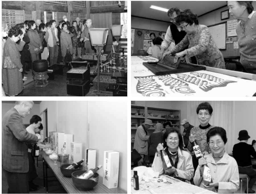
(右上)「ああ懐かしい」を極めるツアーでの鯉のぼり染色体験 (左上) 国宝めぐりツアーで訪れた朝光寺 (右下) 日本酒の手描きオリジナルラベルづくり (左下) 加東市産山田錦から作られた日本酒を堪能

加東市観光協会などの主催で、市内の名所旧跡を訪ねたり、名産品や名物料理を楽しめるさまざまな観光ツアーが行われました。