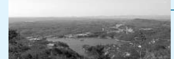
山頂から眺める東条湖