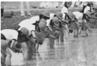
田植え体験の様子（滝野南小児童）

徐々に慣れて作業も早くなると、「大きく育つてね」と願いを口にしながら苗を植えていました。