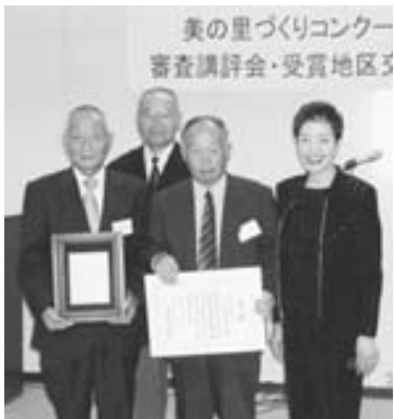
受賞された埴鹿谷土地改良区の役員の方々

今後も、「はしかの里は花いっぱい夢いっぱい」をキャッチフレーズに、積極的に活動を行っていききたいとのことです。