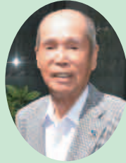
上三草高年クラブの清掃活動の中心となっており、20年以上、ボランティアを続けてこられました。

わたしは、子どものころから上三草に住んでいました。一緒に住んでいたひいじいさんから、義経や弁慶の話をよく聞いたものです。昔、三草山に隣接する昭和池には陸軍の演習場があったので、銃の葉きょうを拾いに行ったり、それから三草山に登って源平合戦の名所旧跡を見に行ったり、栗拾いをしたりというコースでよく遊んでいました。