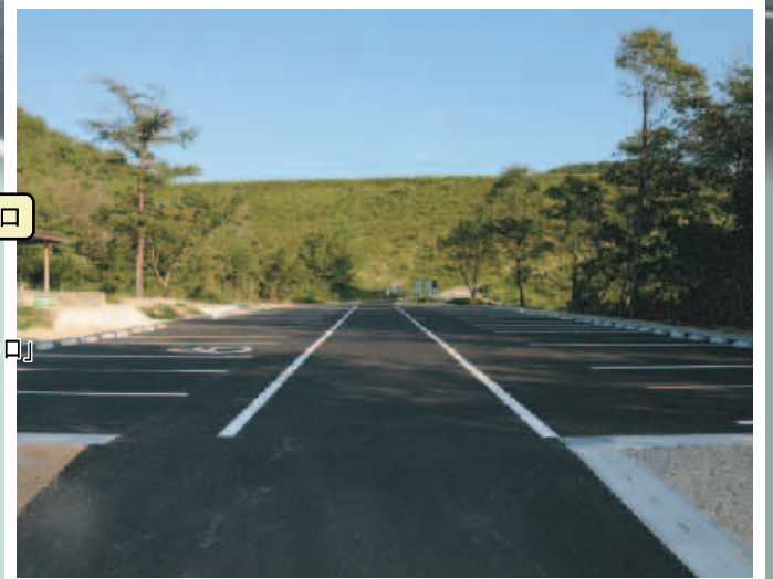
38台の駐車が可能となり、トイレ前には車いす利用者のための駐車スペースもできました。

源平争乱の古戦場として知られ、多くの歴史ファンを虜にしている三草山。近年では、家族で楽しめるハイキングコースとして、人気を呼んでいます。 そんな三草山を、さらに多くの方に訪れていただき、より快適に登山・散策を楽しんでいただくため、3コース設定している登山コースのうち、三草コースの登山口駐車場とトイレを改修しました。三草コースは、国道372号から登山口駐車場へ容易に進入できるため、特に利用者が多いコースでしたが、駐車場に未舗装の部分があり、駐車できる台数が限られていたこと、備え付けのトイレが男女兼用であったことから、改修の要望も多く届けられていました。 今回の改修で、駐車場に全面舗装を施し、駐車できる台数をこれまでの20台から38台に増やしました。トイレは男女それぞれに専用区画のある水洗式トイレに建て替え、障がいのある方や高齢者にも利用しやすい多目的トイレ（段差を解消し、手すり等を取り付けたトイレ）も併設しました。 山登りに適した好季節。さらに利用しやすくなった三草コース登山口から、秋の自然・景色や、歴史ロマンを満喫しに出かけられてはいかがでしょうか。