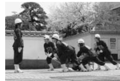
初めて参加した女性消防隊による操法の披露