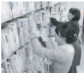
市内図書館にある約40万冊の本を全て点検します。

蔵書点検は、図書館にある全ての本のバーコードを読み取って、本があるべき場所にあるかを点検する作業です。作業中は本・CD等の貸出や返却を行うことができません。