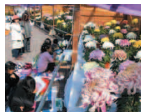
美しく咲いた菊を描く、恒例の 写生大会も開催されます。

日時: 11月2日(土)・3日(日・祝) 10:00~16:00 (菊花盆栽展のみ9:00~) 場所: 市役所社庁舎および滝野庁舎周辺 社会場: 菊花盆栽展 特産品の展示販売 充実のステージイベント 釣り体験 滝野会場: 美術作品展示 キャラクターショー 手づくり市 飲食ブース (同時開催: 平成25年度文化連盟祭) ◎メイン駐車場のやしろショッピングパークBio駐車場と各会場を結ぶ シャトルバスを運行します。詳細は下記事務局か市ホームページまで。 問い合わせ 加東市秋のフェスティバル実行委員会事務局 (加東市役所東条庁舎) ☎ 47-1394