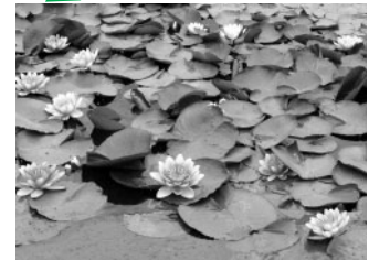
湖面を彩るスイレン。平池公園では4種類のスイレンを楽しむことができます。