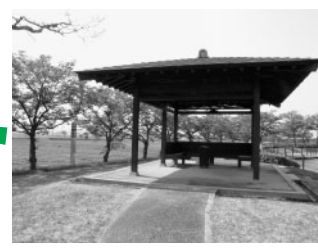
あずまやも整備されており、くつろぎの時間をすごすことができます。