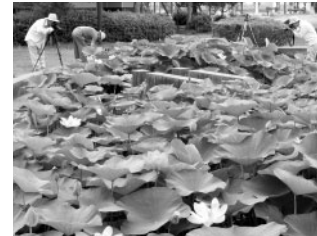
貴重な大賀ハスを間近に見ることができる観察池です。写真撮影スポットとしても有名です。

平池公園は、大賀ハス以外にもさまざまな水生植物でいっぱいです。ここでは、そんな平池公園の魅力をご紹介します。自然観察や写真撮影、そして憩いの場として、ぜひご利用ください。