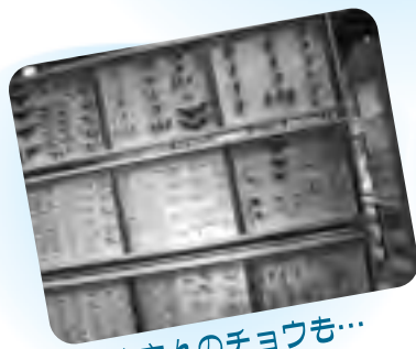
たくさんの子ヨウも...