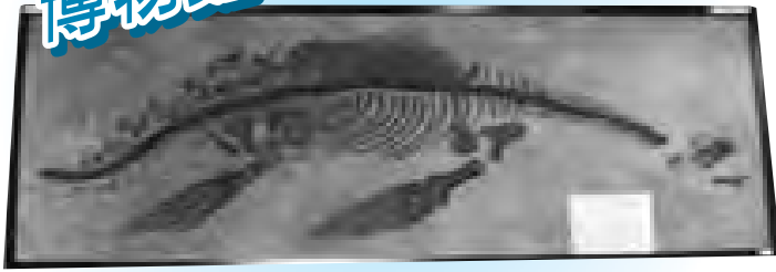
恐竜の化石もやって来ます！