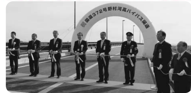
関係者によるテープカット