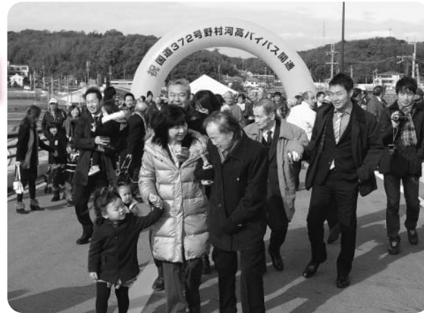
地域の方々が、真新しい道路を歩かれました

12月2日、河高地区と野村地区を結ぶ「国道372号野村河高バイパス」が完成。これにより、全体整備計画5.1kmの全区間が開通しました。