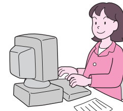
残業でアフタースクールのお迎えが間に合わない!!