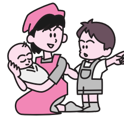
第2子出産「上の子を外で遊ばせたい」