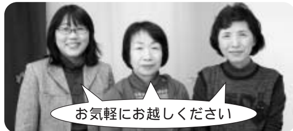
お気軽にお越しください