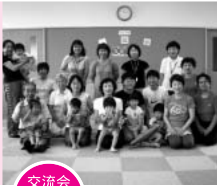
交流会 & 講習会

ファミリー・サポート・センターでは会員の交流会を、年に2～3回行っています。写真は、7月に3B体操を楽しんだときのものです。会員になることで、新しい出会い、つながりができることもファミリー・サポート・センターの魅力です。