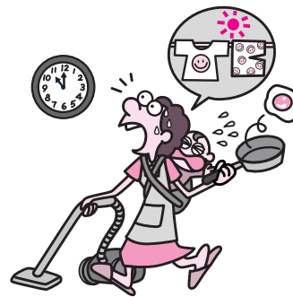
美容院に行きたい!! リフレッシュしたい!!

協力会員になられた方は、年二回開催する講習会に参加していただけます。 両方会員になることもできます 依頼会員として援助を依頼する一方で、余裕のあるときには他の子どもを預かる両方会員になることもできます。 登録方法は? 登録手続きは、ファミリー・サポート・センター事務所で入会申込書など必要書類に記入していただいた後、アドバイザーが利用方法などを説明させていただきます。後日、会員証をお渡します。