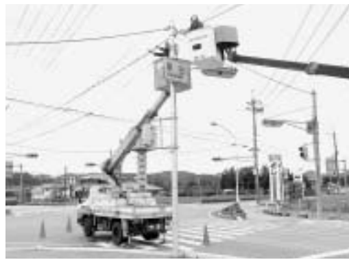
東条地域の幹線ケーブル工事を実施しています。