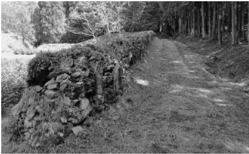
義経が駆け抜けた丹波道

コースは全長約5キロ。その一部は、1184年3月4日の三草合戦の際、源義経の率いる1万騎が、三草山に陣取る平資盛などを夜襲した際に通ったといわれる「丹波道」です。また、西国霊場25番札所である清水寺に自動車道が整備されるまでは、巡礼道として利用されていた「西坂」も歩いていただきます。