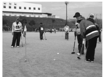
グラウンドゴルフ