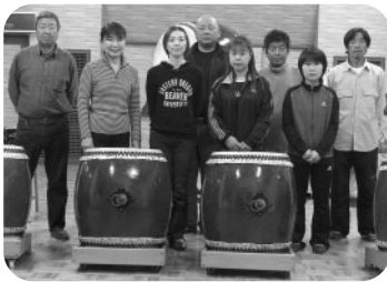
ともしびの賞 水龍会

永年にわたり地域の歴史を題材とした創作和太鼓の演奏に取り組むとともに、後進の指導育成に努めるなど、地域文化の向上に尽くされました。