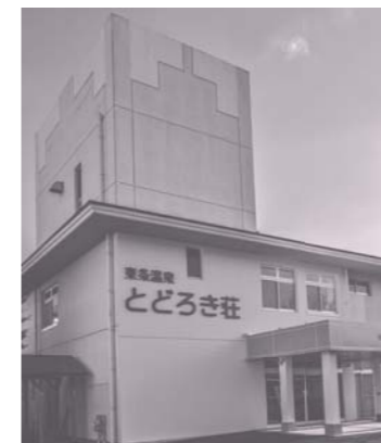
○施設の顔であるサインは、見やすいデザインに新調されています。