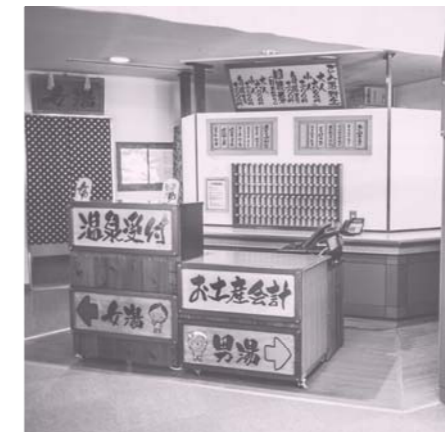
○温泉の受付。案内板は、客室にあった家具を再利用して作っています。

改修工事のため休館していた東条福祉センター「とどろき荘」は、従来の温泉施設・福祉施設の機能に、東条公民館の機能を加えた複合施設として、3月1日(木)に営業を再開しました。 身近な保養の場としてはもちろん、地域交流の拠点として、変わらぬご愛顧をいただきますようお願いいたします。