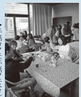
▶手話カフェ(手話フェスタ)