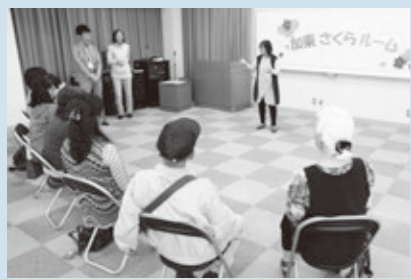
▲加東さくらルーム

申請に必要なもの ・健康保険証 ・福祉医療費受給者証(乳幼児等・子ども) ・対象となる公費負担医療制度の受給者証 ・他の公費負担医療助成を受けた後の領収書(平成30年7月診療以降のもの)