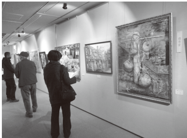
（写真 第15回加東市公募美術展 展示の様子）

加東市公募美術展は、美術を愛好するみなさまから広く作品を募集し、入賞・入選作品の鑑賞を通じて、創作意欲を高めるとともに、地域の芸術活動の振興となることを目的に開催しています。