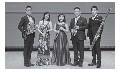
▲京都市交響楽団のみなさん