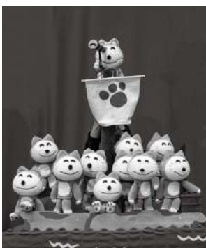
原作/馬場のぼる (c)てれび