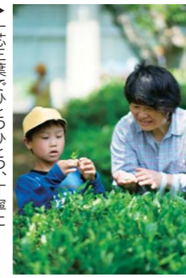
「ふれあい茶摘み」は、三草小学校で毎年恒例の『ふれあい茶摘み』が行われ、さわやかな春空のもと、多くの人が茶摘みを楽しみました。この茶摘みは、昭和53年、旧三草中学校の敷地に三草小学校が移転し、茶畑を継承したときから、保護者も参加する恒例行事として続いています。現在は、老人会や三草ふれあい広場など地域の方も参加されています。

5月12日、三草小学校で、毎年恒例の『ふれあい茶摘み』が行われ、さわやかな春空のもと、多くの人が茶摘みを楽しみました。この茶摘みは、昭和53年、旧三草中学校の敷地に三草小学校が移転し、茶畑を継承したときから、保護者も参加する恒例行事として続いています。現在は、老人会や三草ふれあい広場など地域の方も参加されています。