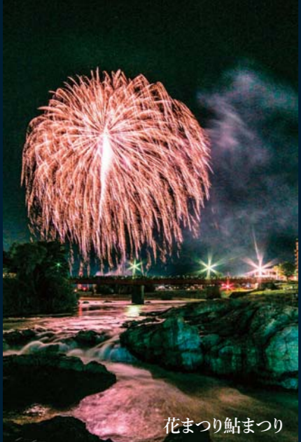
花まつり鮎まつり