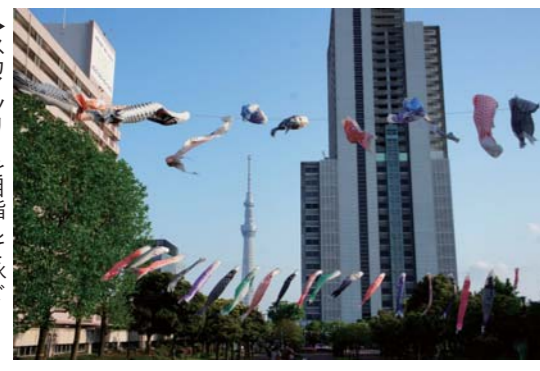
▲スカイツリーを目指して泳ぐ鯉のぼり(すみだ鯉のぼりフェア)

『すみだカッター倶楽部』が主催した『すみだ鯉のぼりフェア』で、市民のみなさんに募集し、寄贈いただいた