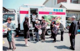
▲移動販売車による買い物の様子

出発式では、移動販売車の運転手に花束を手渡すなどのセレモニーが催されたほか、加東市・滝野地域連絡会・コープこうべの3者が締結する『加東市滝野地域の活性化に関する連絡協定』の締結が発表されました。その後、実際に販売の様子