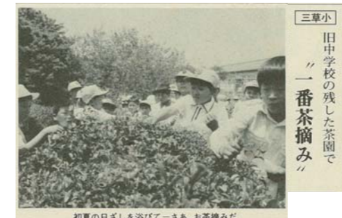
三草小 旧中学校の残した茶園で「一番茶摘み」 初夏の日差しを浴びて一さあ、お茶摘みだ ▲昭和54年に行われた茶摘みを紹介した記事(広報やしろ昭和54年第230号から抜粋)

5月12日、三草小学校で、毎年恒例の『ふれあい茶摘み』が行われ、さわやかな春空のもと、多くの人が茶摘みを楽しみました。この茶摘みは、昭和53年、旧三草中学校の敷地に三草小学校が移転し、茶畑を継承したときから、保護者も参加する恒例行事として続いています。現在は、老人会や三草ふれあい広場など地域の方も参加されています。