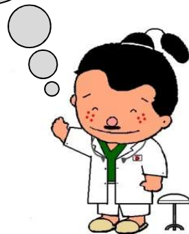
加東市マスコット 加東伝の助