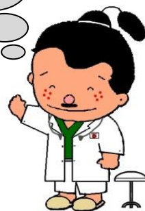
加東市マスコット 加東伝の助