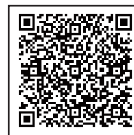
イクメンプロジェクト

育休を取得し、積極的に育児に参加するパパたちを紹介しています。育児参加に意欲を持ったパパたちは必見です。