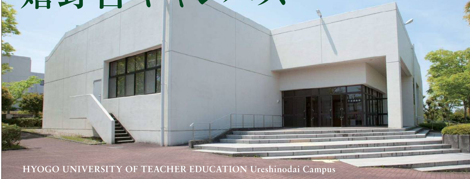
HYOGO UNIVERSITY OF TEACHER EDUCATION Ureshinodai Campus