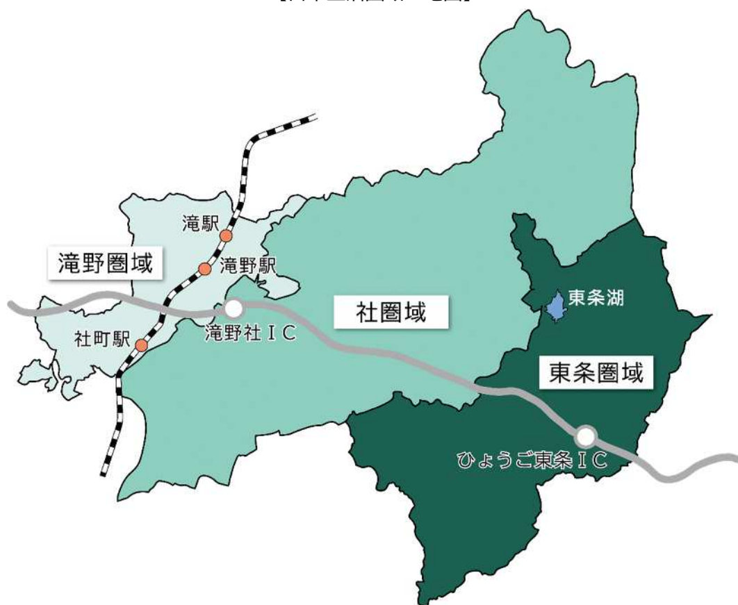
【日常生活圏域 地図】