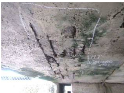
床版に鉄筋露出が見られます