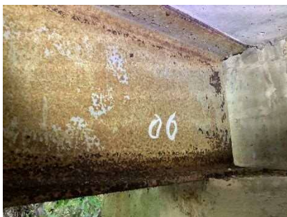
主桁に腐食が見られます