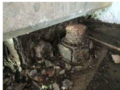
支承に腐食が見られます