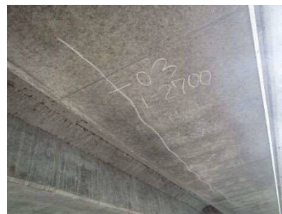
主桁にひびわれが見られます