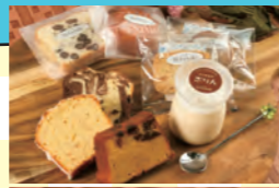
洋菓子ブランド「Hitotoki 人と季」では、きび糖を使用した焼菓子や、やさしい甘さのケーキを販売

●加東市平木200 ●中国道ひょうご東条ICから車で20分 ●10~16時 ●火・水曜(祝日の場合は翌日) ●5台