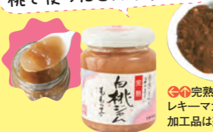
●完熟白桃ジャムや、桃ピューレ、桃を使った加工品は通年販売