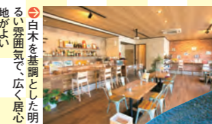
白木を基調とした明るい雰囲気で、広く居心地が良い

よくばりいちごっぺ ●1月中旬~6月中旬 ※価格は要問合せ 春はイチゴ、夏はメロン・マンゴー・桃、秋はシャインマスカット(上写真)・栗などのフラッペが登場。販売中のメニューは公式インスタグラムでチェック!