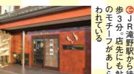
JR滝野駅から徒歩3分。店先にも鮎のモチーフがあしらわれている