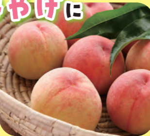
桃を使ったこんな製品も!

白鳳などの完熟桃をブランド化したもので、大きくて甘味たっぷり。販売期間はひと月程度。道の駅のほか、県道17号沿いの直売所でも販売(詳細は「JAみりのやしろの桃」で検索)。