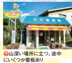
山深い場所に立つ。途中にいくつか看板あり

おみやげ フルーツブレンド ハチミツ 各280円760円 ザクロやブルーベリーの果汁入りであっさり食べやすい。ヨーグルトにも合う