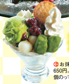
●抹茶パフェ(M)650円。抹茶アイスが2個のってボリューム

お店の前のローバーミニが目印のおしゃれカフェ。おすすめはフルーツがこぼれ落ちるほどのパンケーキ。地元の野菜を使った定食やカレー、挽きたてのコーヒーも好評。 ●加東市厚利4-5 ●中国道ひょうご東条ICから車で10分 ●11~16時(土曜は8~20時、日曜、祝日は8~16時) ●火曜 ●40台