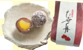
たかせ舟1個180円。栗の甘露煮に白餡と小豆餡を重ねた風流な1粒

●加東市上滝野833-6 ●中国道滝野社ICから車で3分 ●9~18時 ●水曜、第1・3・5火曜 ●2台