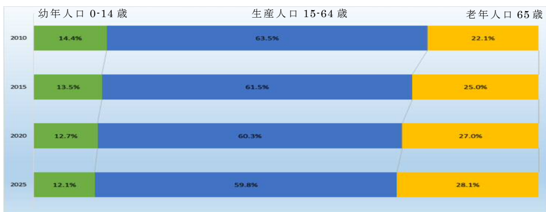
【加東市年齢別人口推移】