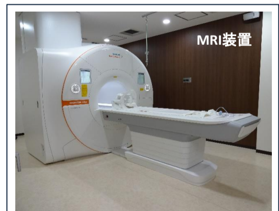
シーメンス社製1.5テスラ