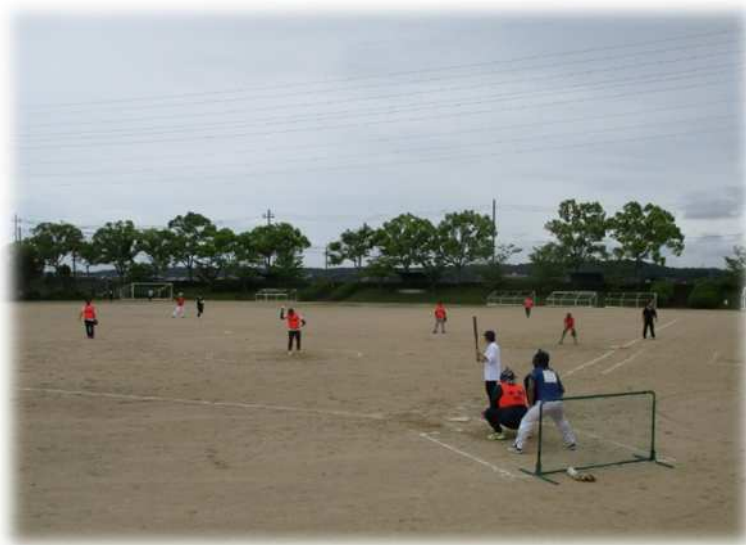
地区親善ソフトボール大会