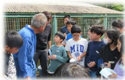
ふれあい体験学習

子どもたちの社会性を育成し、地域への愛着を醸成するなど「社会に開かれた教育課程」を実現するために、学校運営協議会と連携して地域人材を積極的に活用し、子どもたちの学びや体験活動を充実させます。