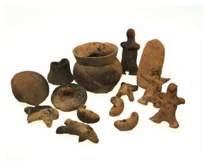
兵庫県指定文化財「河高・上ノ池遺跡出土祭祀土製品ほか一括」