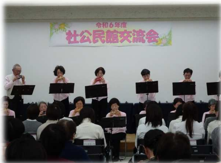
公民館サークルのステージ発表