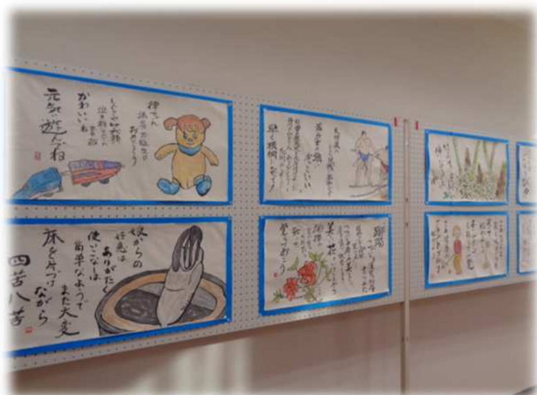
公民館サークルの作品展示