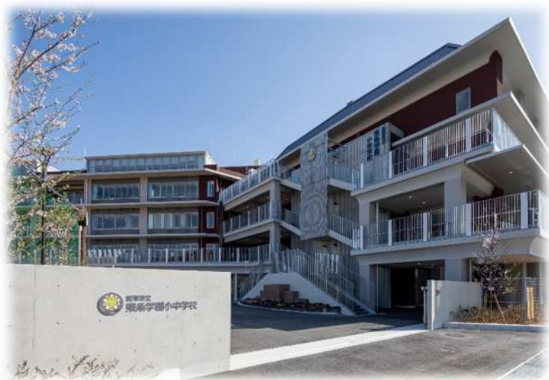
東条学園小中学校