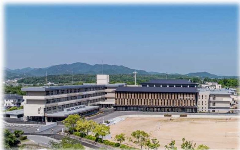
社学園小学校・社学園中学校