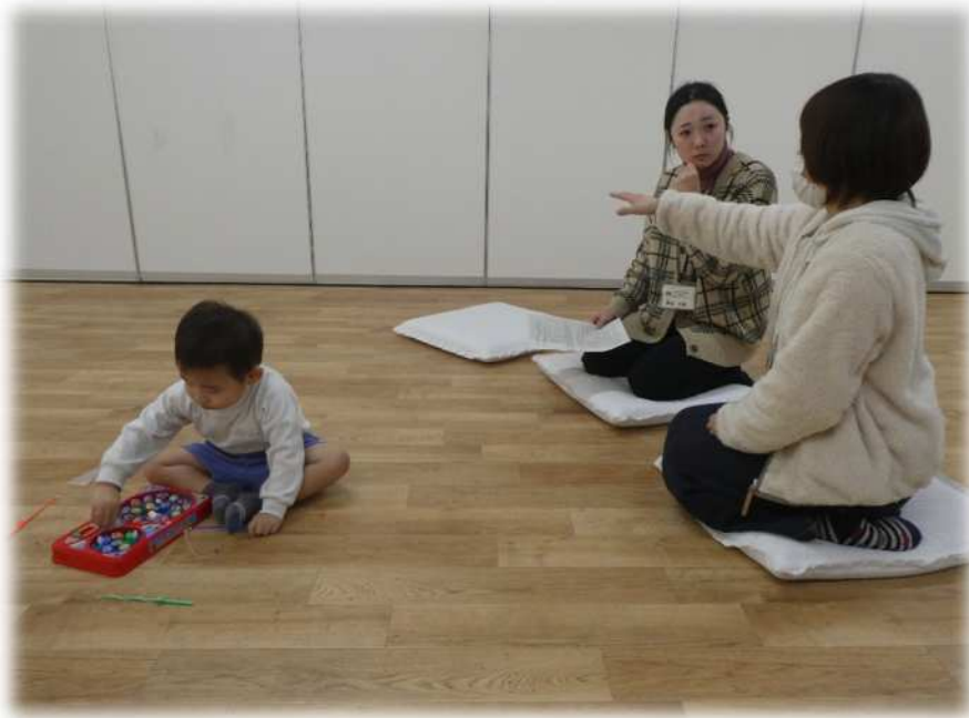
子どもの発達・何でも相談室