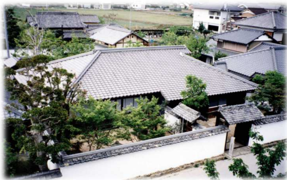
加東市指定文化財「三草藩武家屋敷旧尾崎家」