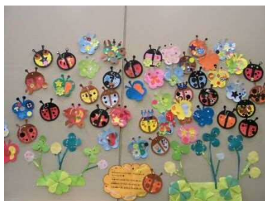
「はるのいきもの」をかざろう