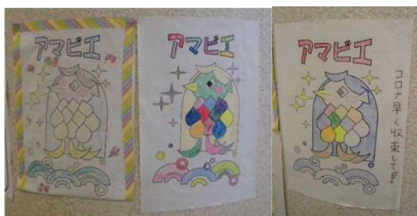
「アマビエ」のぬりえ