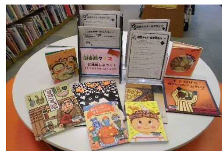
「図書館クイズ」「読書クイズ」