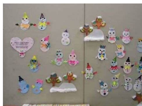
「ゆきだるま」をつくろう