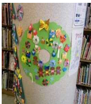
「クリスマスのかざりをつくろう」