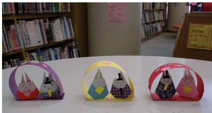
「おひなさまをつくろう」