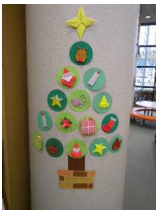
「クリスマスツリーをかざろう」