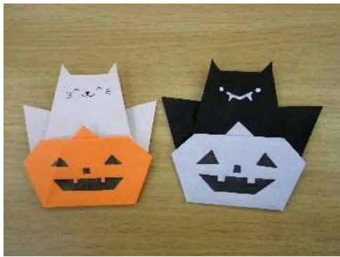
「おりがみでハロウィーンを楽しもう」