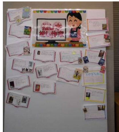
「推し本・推し作家」コーナー