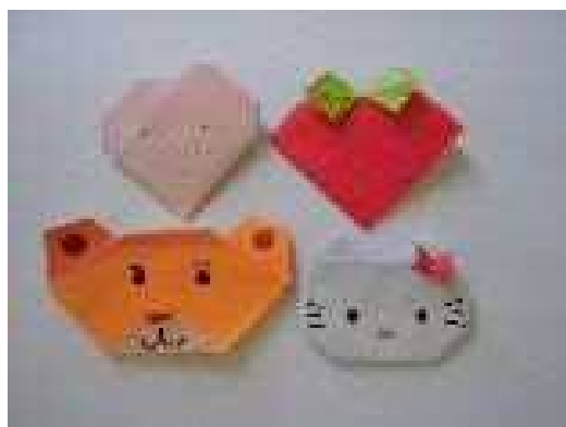
「おりがみで手紙をつくろう」