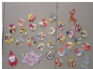
「ふゆのリースをつくろう」