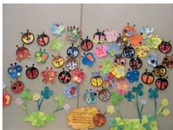
「はるのいきもの」をかざろう