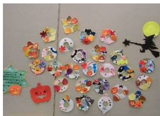
「あきのリースをつくろう」