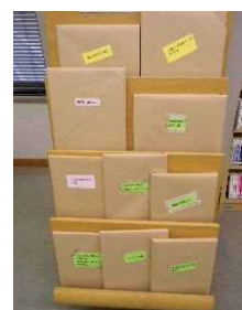
「絵本を読んでみませんか」