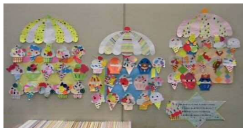
「なつのスイーツをかざろう」