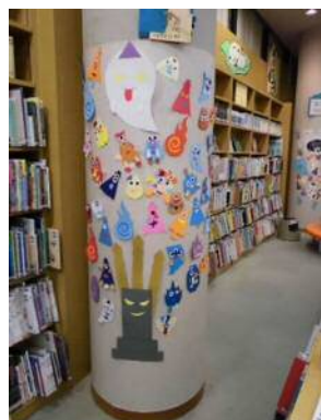
「おばけをつくろう」