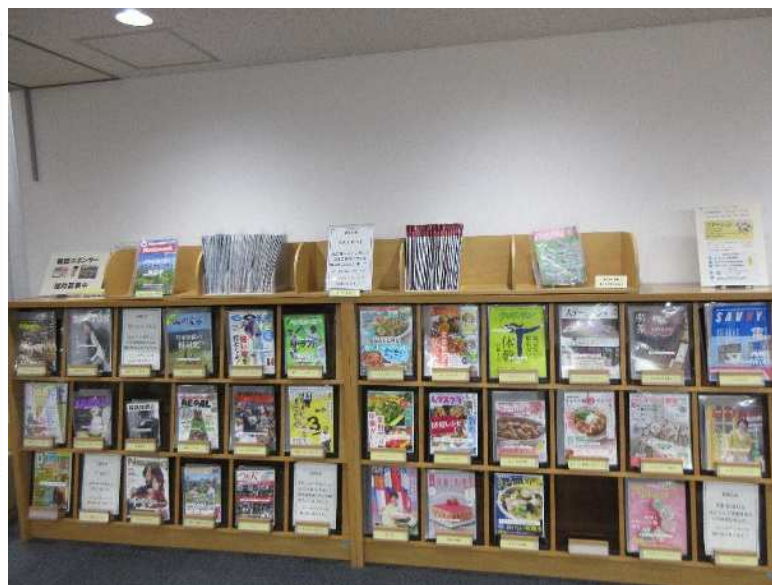
中央図書館の雑誌コーナー