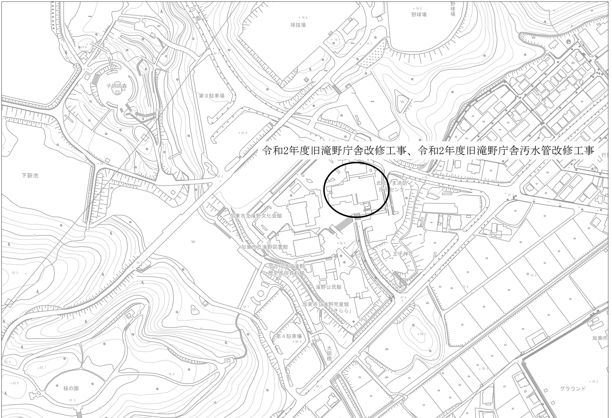
令和2年度旧滝野庁舎改修工事、令和2年度旧滝野庁舎污水管改修工事