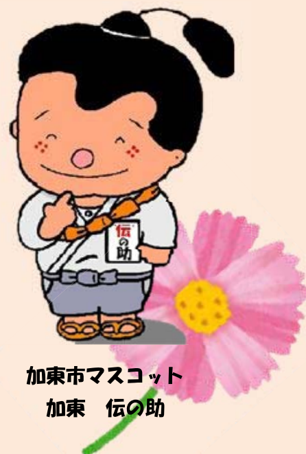
加東市マスコット 加東 伝の助

「お弁当を届けてほしい…」「掃除を手伝ってほしい…」などでお困りの方へ、ご自宅へ直接出向いてくれるお店の情報がつまった『お助け帳』です。