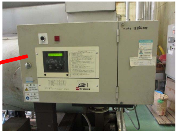
制御盤（経年による誤作動のため更新）