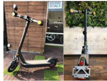
【電動キックボード】