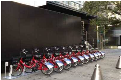
【シェアサイクル（電動アシスト自転車）】