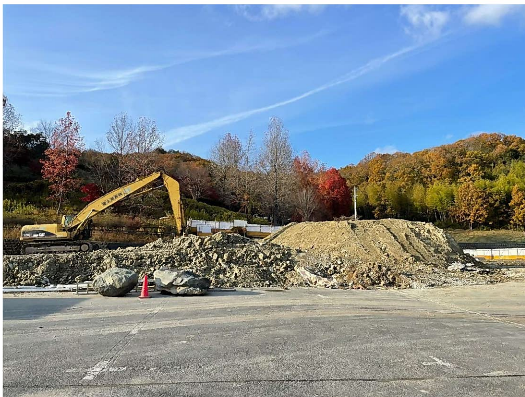
旧東条中学校校舎棟 解体後（東側 正面玄関側）