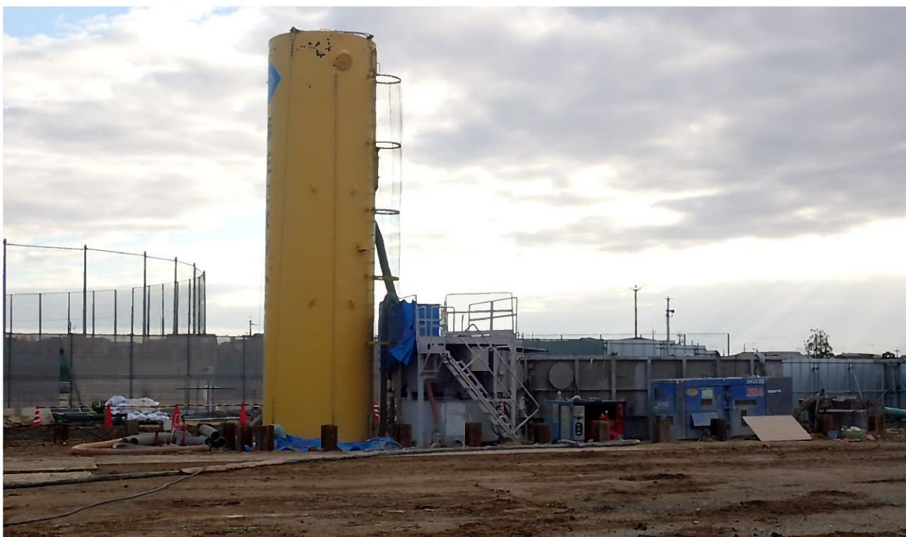
増築校舎棟 杭周固定液注入用プラント