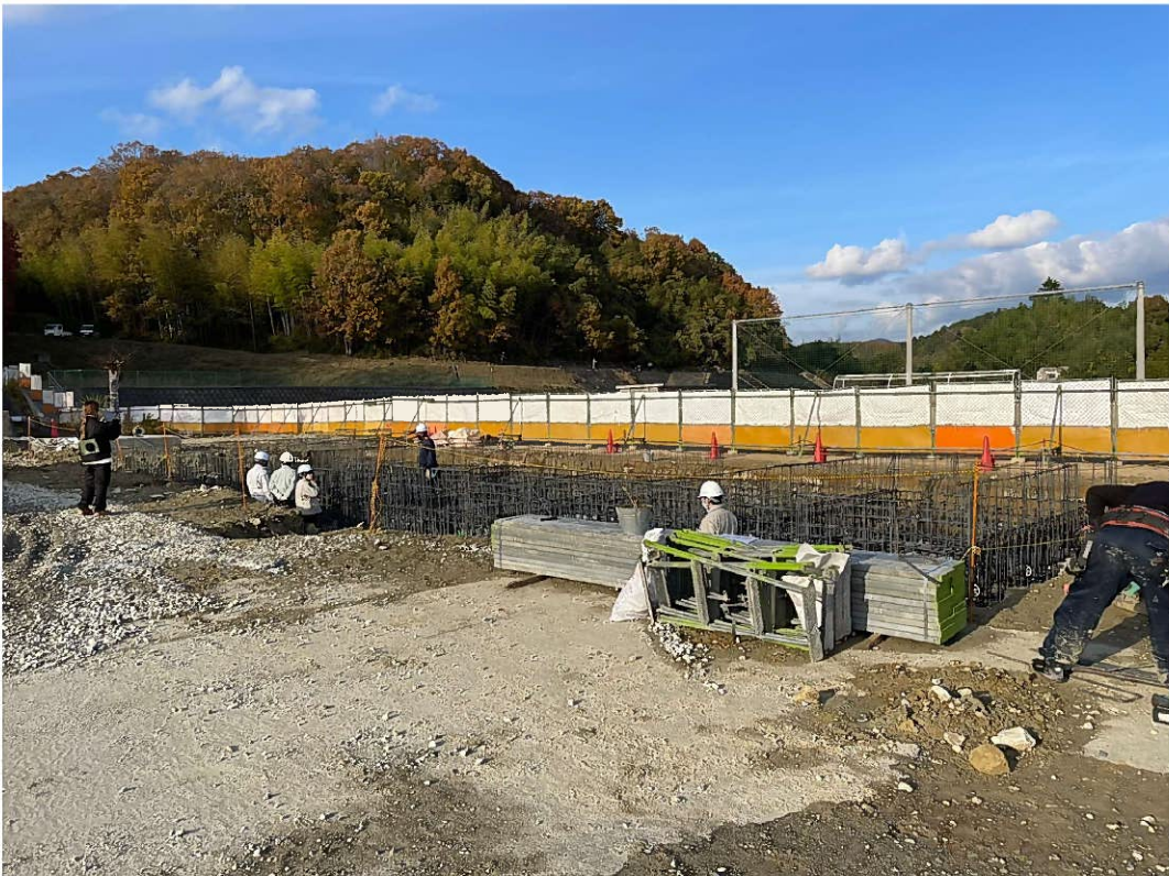
部室棟 基礎配筋検査