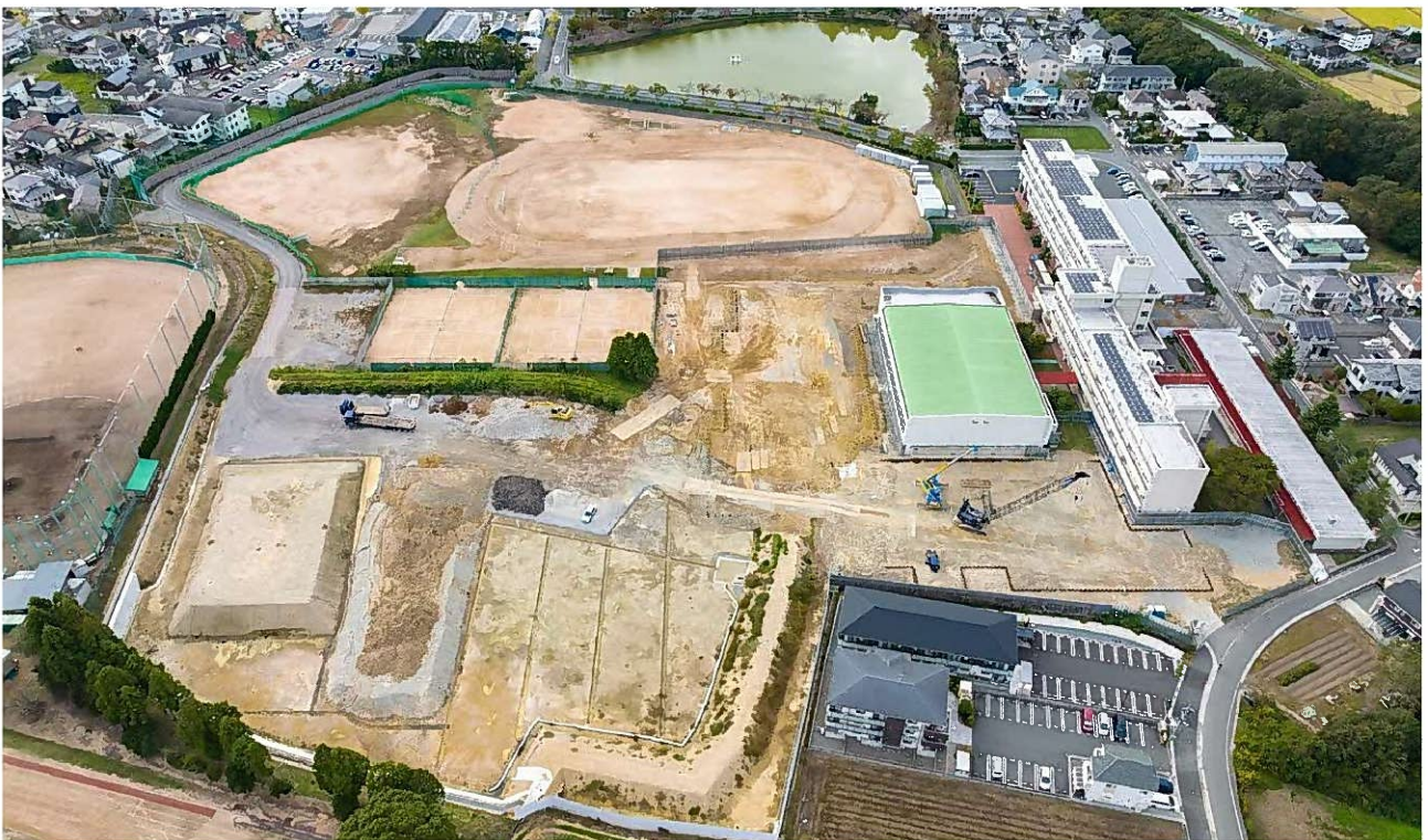
全景 東側上空から撮影（令和4年10月末）