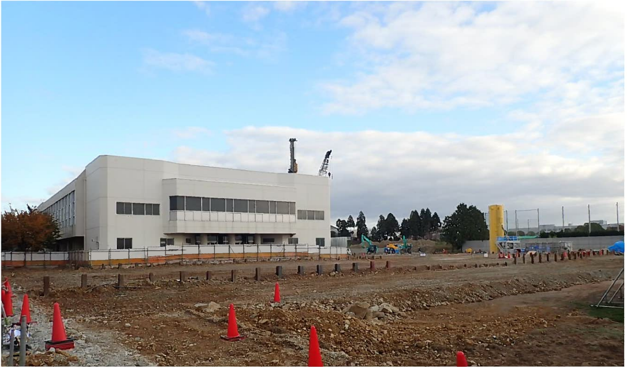
交流棟建設地状況