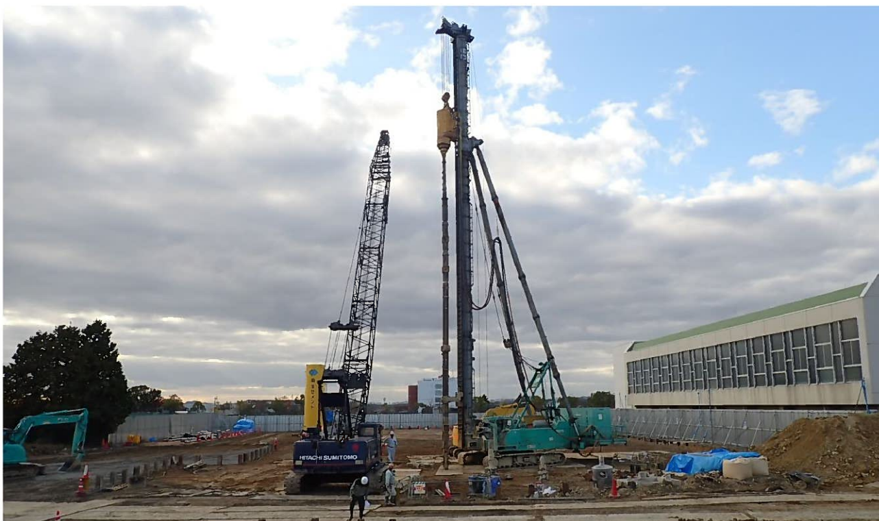
増築校舎棟 基礎杭打設状況