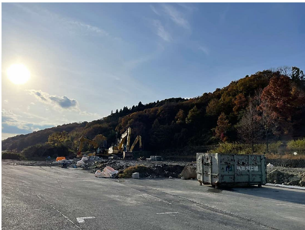
旧東条中学校校舎棟 解体後（西側 生徒昇降口側）