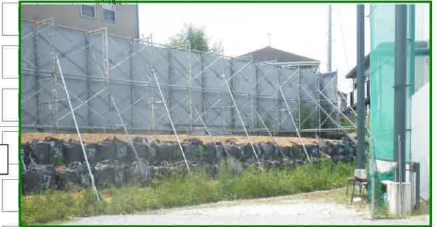
↑ (4) の現況写真