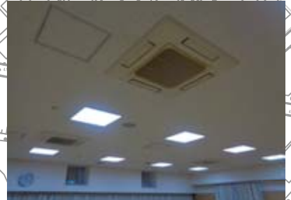
空調設備・照明設備