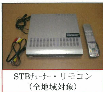
(宅内設置機器類:回収品)※旧KCV加入者のお宅に残っている可能性があるもの