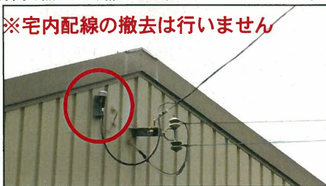
(保安器:屋外撤去工事)