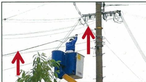
(伝送路:屋外撤去工事)