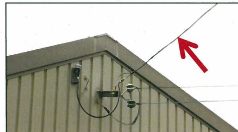
(引込線:屋外撤去工事)